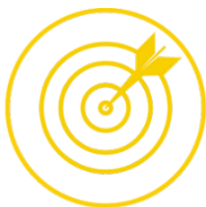
Comportamento direcionado a metas