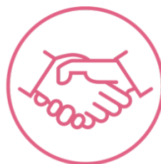
Habilidades de relacionamento