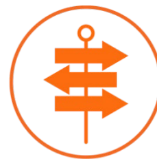
Tomando uma decisão